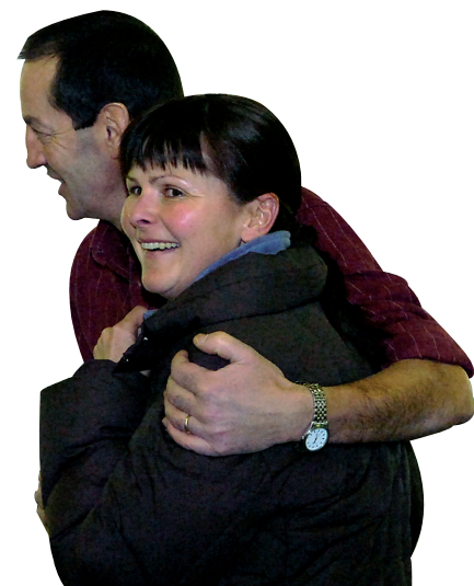
C'est oui. Les partisans n'y croyaient pas. LE JDS