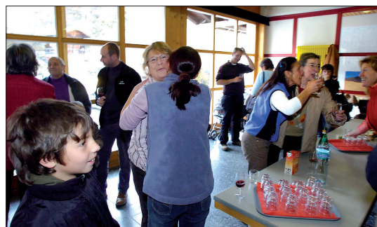
Scène de joie au centre scolaire. Il est 13 heures.